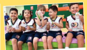
Aula em Campo