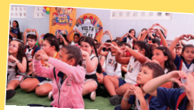
Volta às Aulas