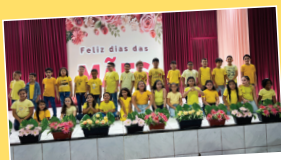
Dia das Mães