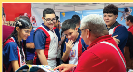
Bienal do Livro