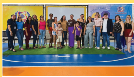
Roda de Conversa