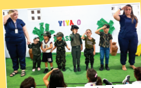
Dia do Soldado