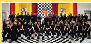
Dia dos Pais