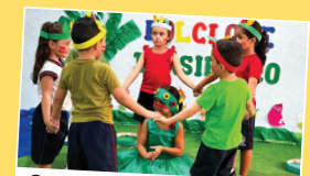
Semana do Folclore